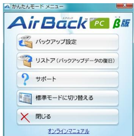
ホーム画面（かんたんモード）

とりわけ「かんたんモード」は、バックアップ対象とバックアップデータの保存先を設定するだけで後は無意識にリアルタイムバックアップをご利用いただける Air Back for PC ならではの機能です。