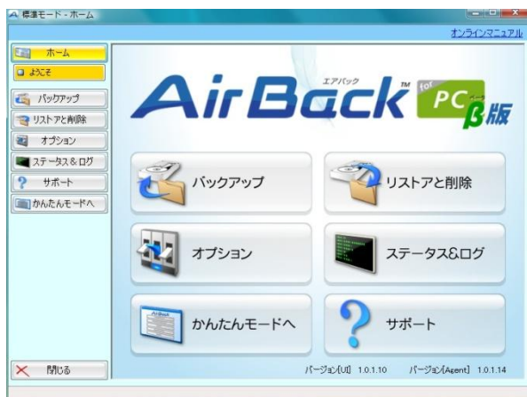
ホーム画面 (標準モード)